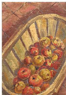
Le cageot de pommes (3 P) Année inconnue (mais René était très jeune)