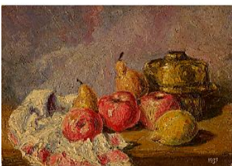
Les fruits (17 x 24 cm) 1937