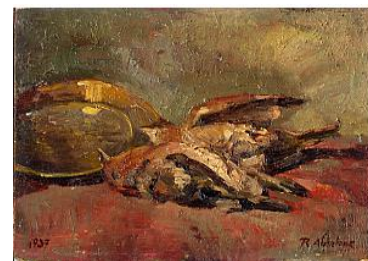
Les oiseaux morts (16 x 22 cm) 1937