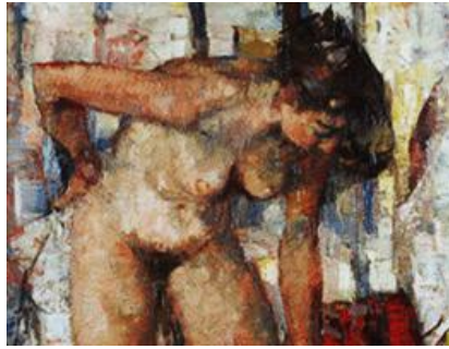
Huile sur toile "Femme nue", N° 70 du fond d'art contemporain en fait : "La toilette (III)" 30 F = 74 x 92 cm