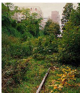
Le chemin de fer de « Petite Ceinture » à Paris 15 e , sous les fenêtres de l'atelier de René Aberlenc (au fond, le pont de la rue Brançon)

« (...) l'expressionnisme vigoureux de Beaucé, Aberlenc. (...) »